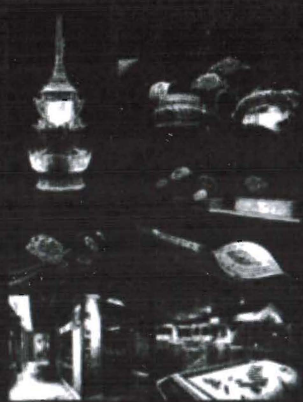
ภาพ เครื่องใช้ เครื่องมือ เครื่องใช้ เครื่องมือ เครื่องใช้